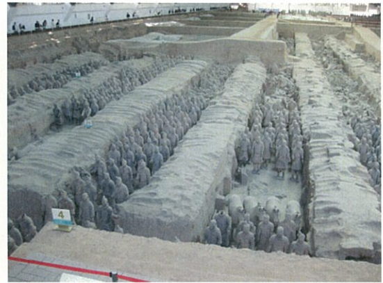
091 (10/16 兵馬俑抗博物館)