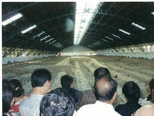
092 (10/16 兵馬俑抗博物館)