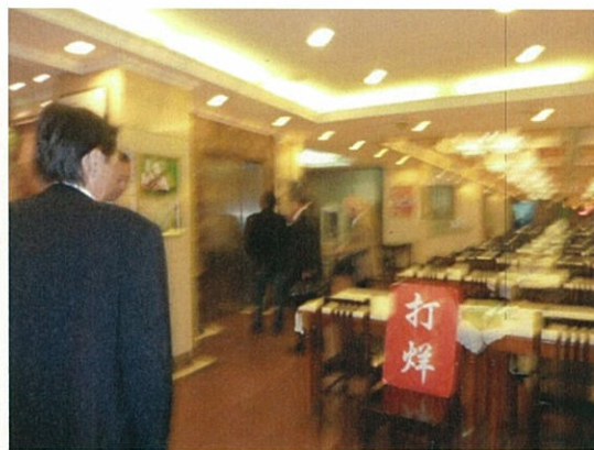
078 (10/15 予約店 営業時間終了)