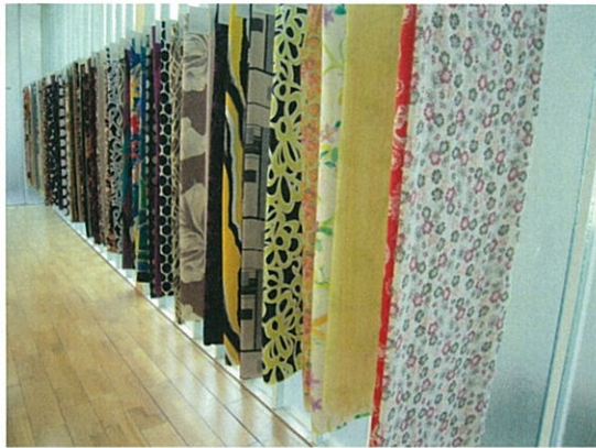
067 (10/15 達利 ショールーム)