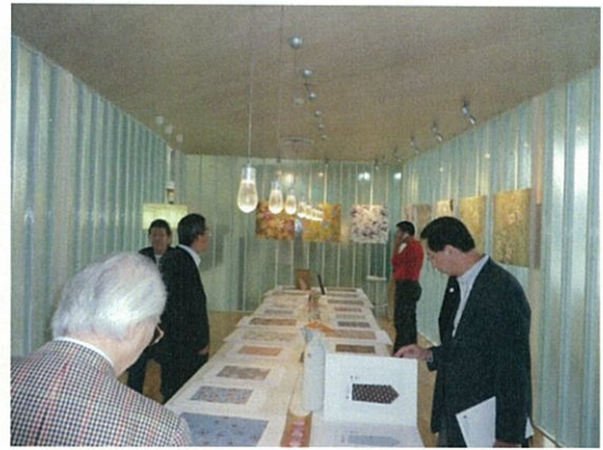
065 (10/15 達利 ショールーム)