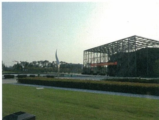
069 (10/15 達利 工場群敷地内)