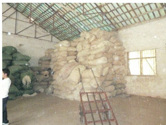
113 (10/17 横県桂華 繭集荷)