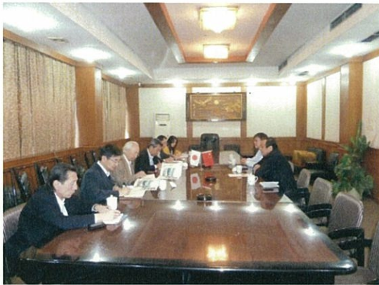
133 (10/18 富强との懇談)