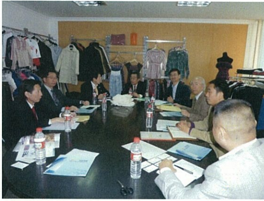
087 (10/16 陝西開成との懇談)