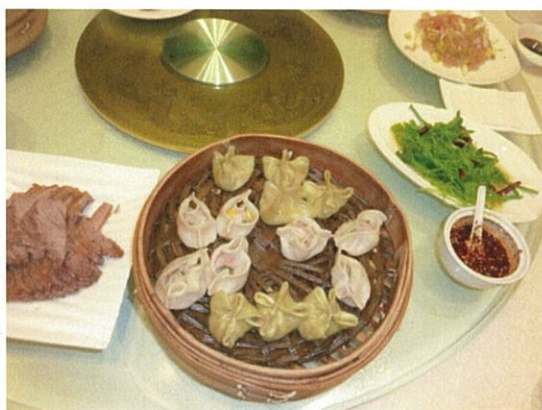
077 (10/15 西安 名物 17 種の餃子)