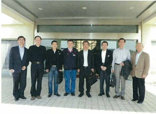
064 (10/15 華豪針織 正面)