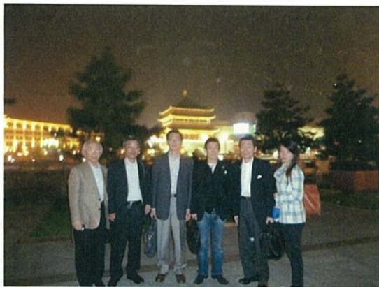
072 (10/15 西安 鐘樓前)