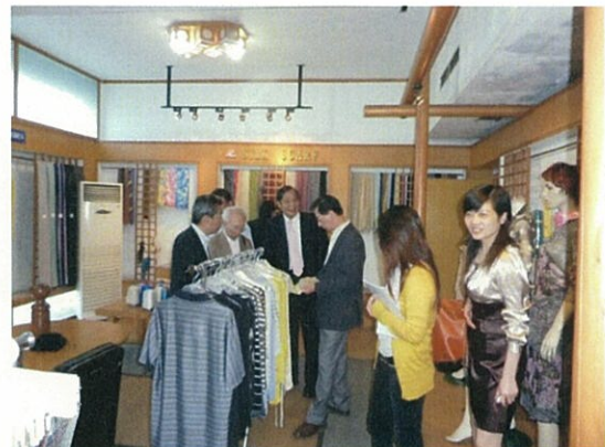
144 (10/18 富强ショールーム)