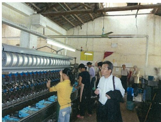
105 (10/17 横県桂華 製糸)