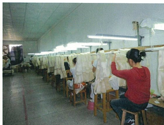
111 (10/17 横県桂華 玉糸検査)