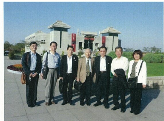
100 (10/16 西安博物館前)