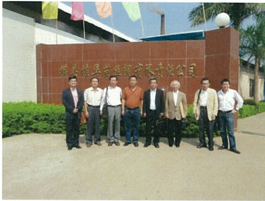
127 (10/17 横县桂华 正面)