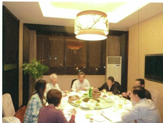
075 (10/15 西安 夜晚の打合せ 餃子店)