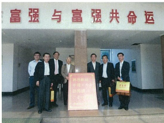
143 (10/18 富强 正面)