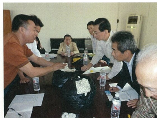
125 (10/17 横県桂華との懇談)