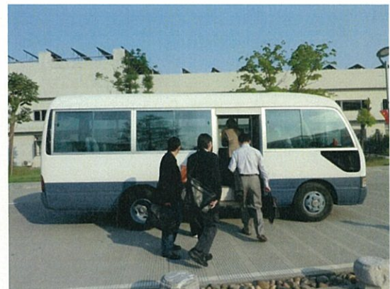
071 (10/15 達利 敷地内移動バス)