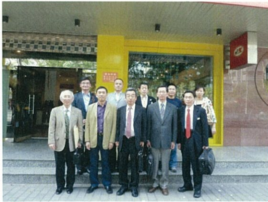
089 (10/16 陝西開成ビル 正面)