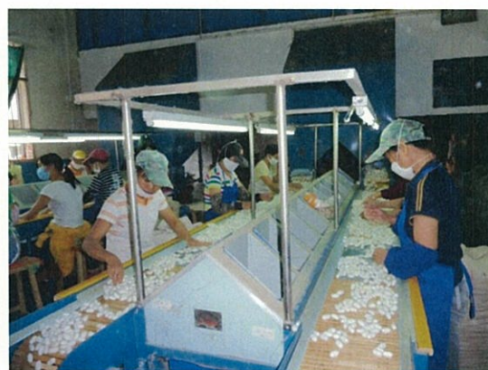
115 (10/17 横県桂華 繭検品)